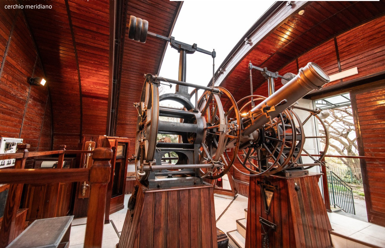
Osservatorio Astronomico di Capodimonte cerchio meridiano