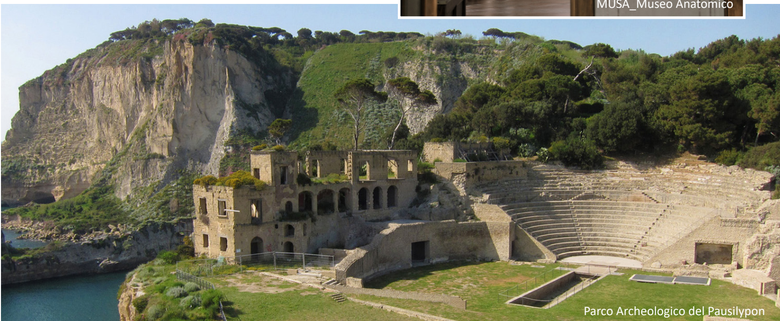
Parco Archeologico del Pausilypon