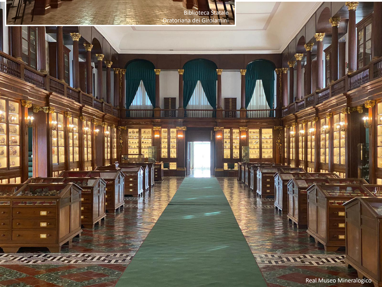
Real Museo Mineralogico

Come sottolineato dal Delegato del Sindaco per le biblioteche e la programmazione culturale Andrea Mazzucchi : « Il Maggio dei Monumenti si configura sempre più come un grande festival che attraversa la città non solo nei suoi luoghi monumentali, ma anche nel suo patrimonio vivo: fatto di atelier, laboratori artistici,