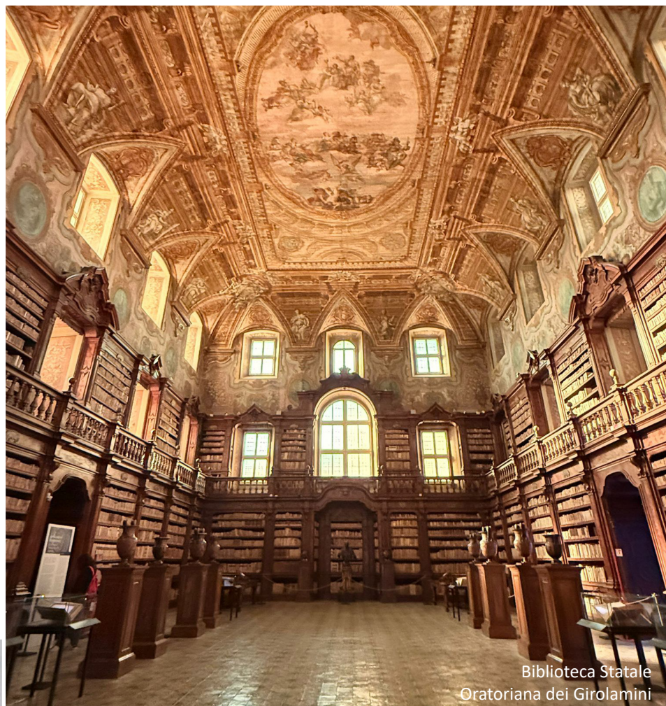
Biblioteca Statale Oratoriana dei Girolamini

te il campo, dal racconto sensoriale del vino ai codici miniati della Biblioteca dei Girolamini , fino alle sperimentazioni tra suono, luce e vibrazione. In questo mosaico di linguaggi, "Prismi" dimostra come il colore non sia mai un semplice attributo visivo, ma un'esperienza complessa che attraversa saperi, discipline e comunità.