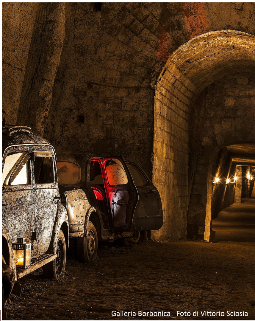
Galleria Borbonica

Il programma della sezione Prismi è disponibile al seguente link Maggio dei Monumenti 2026 - Comune di Napoli .