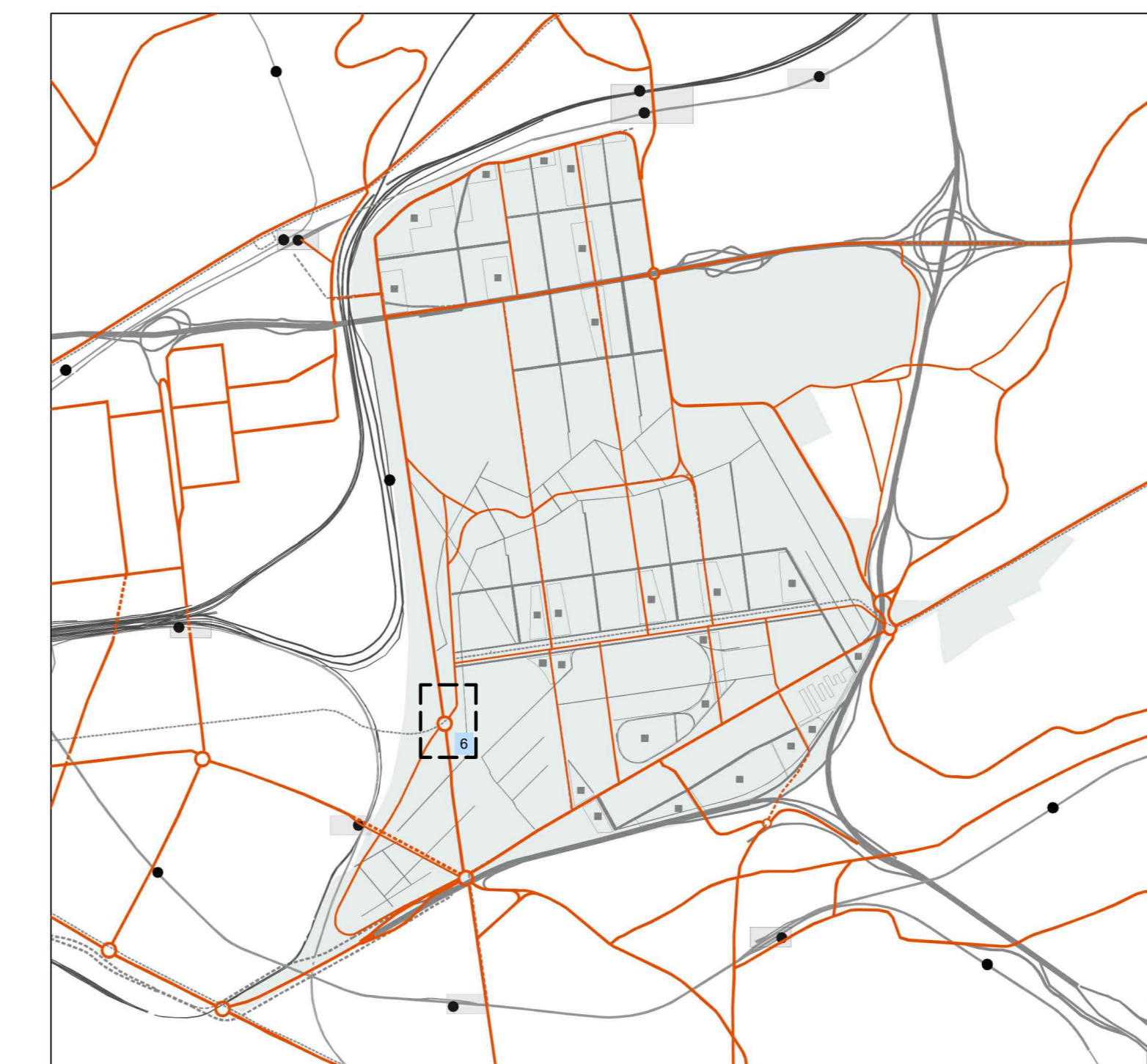
la rete della viabilità primaria