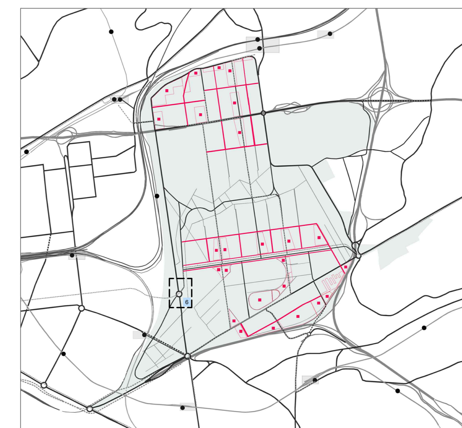
la viabilità locale di connessione tra gli isolati e il sistema dei parcheggi