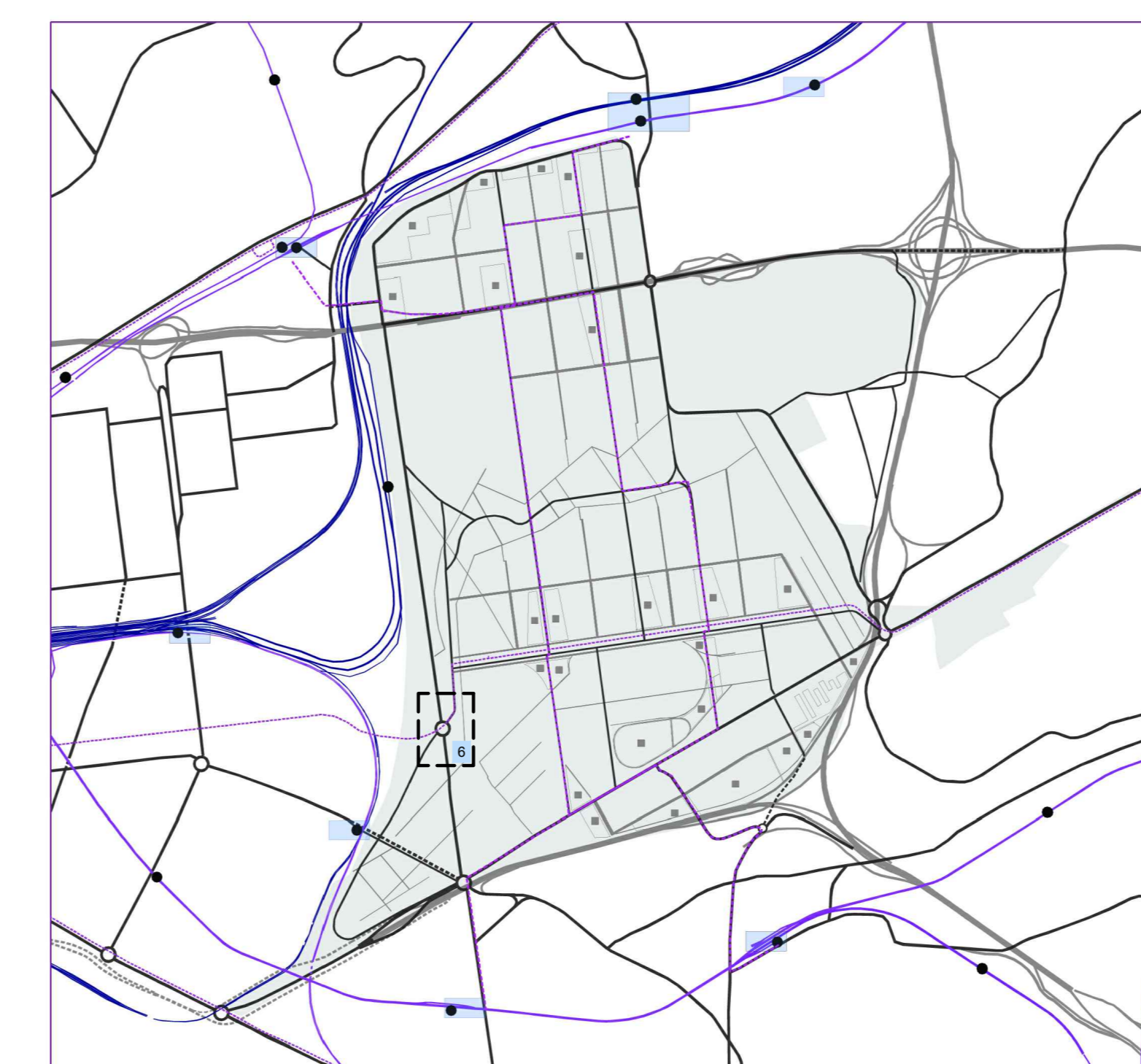
il sistema della mobilità su ferro ed i nodi di interscambio