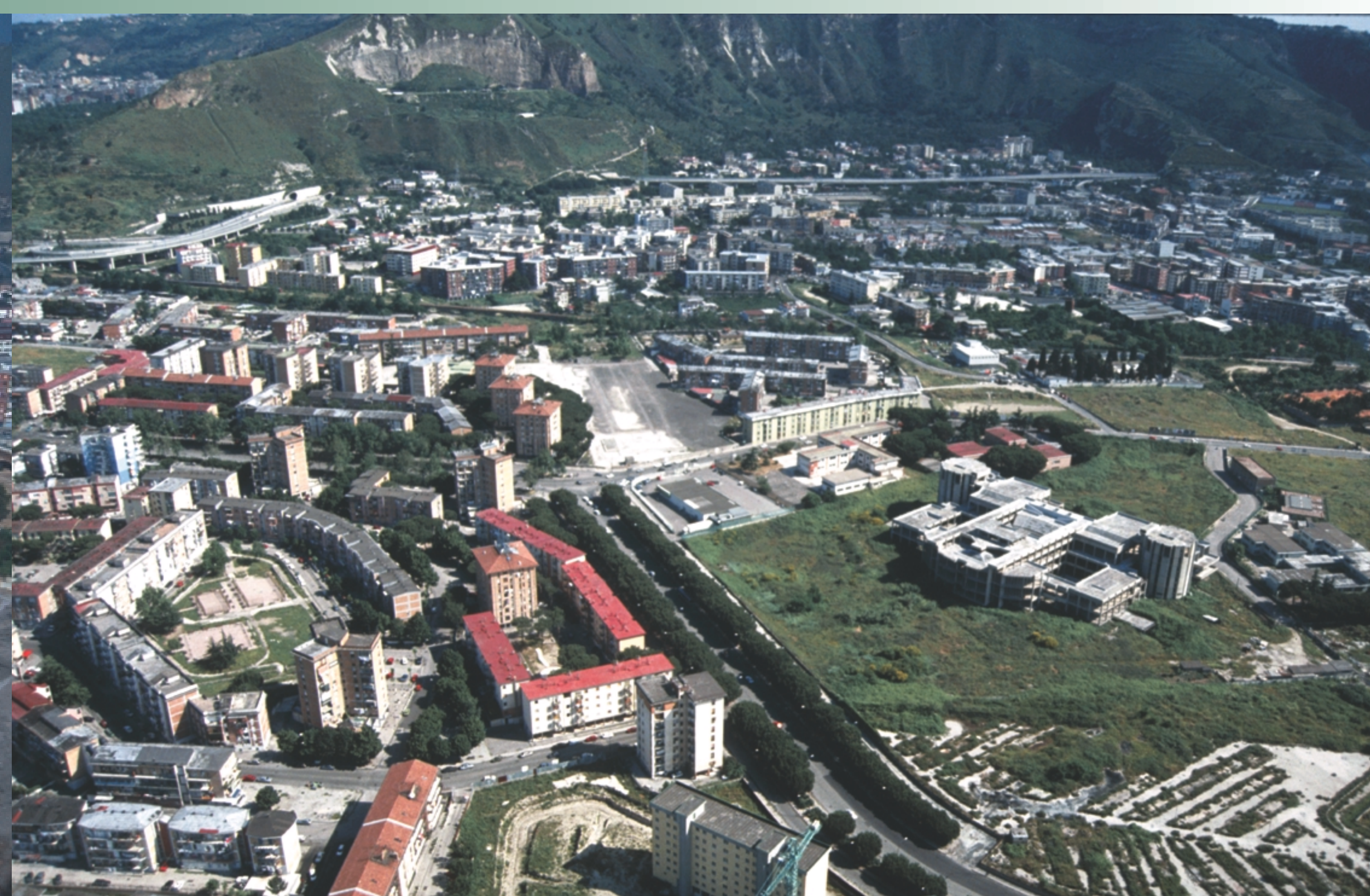
▲ Veduta aerea del rione Traiano, in primo piano sulla destra, il centro polifunzionale