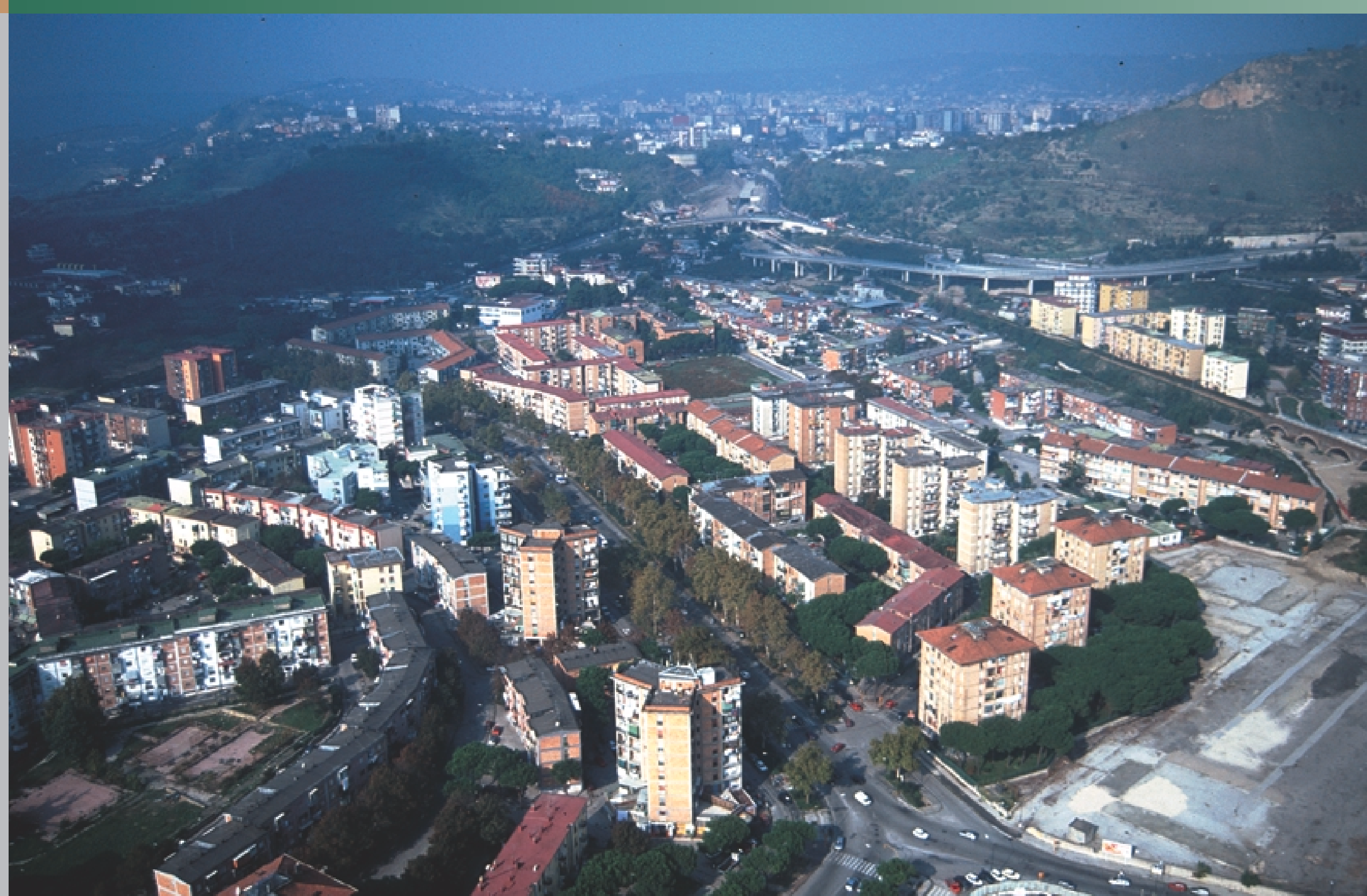
▲ Panoramica nella prospettiva di viale Traiano

Programma di recupero urbano di Soccavo Assessorato all'edilizia, servizio edilizia pubblica