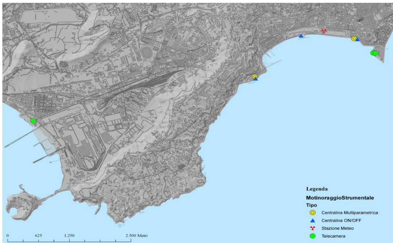
Posizione delle strumentazioni del sistema S.I.M.P.A.C.