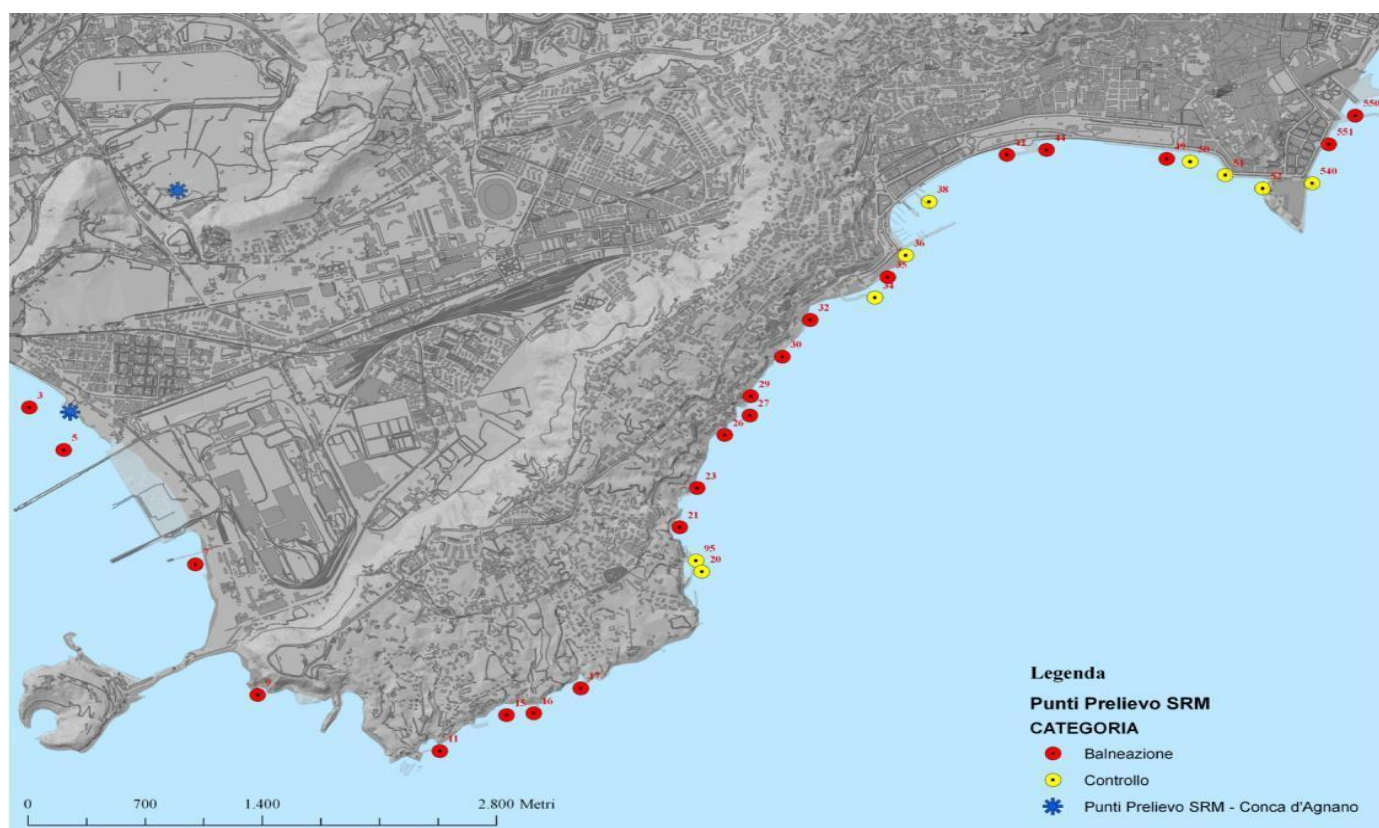
Posizione dei punti di prelievo della rete di Monitoraggio del S. T. M.