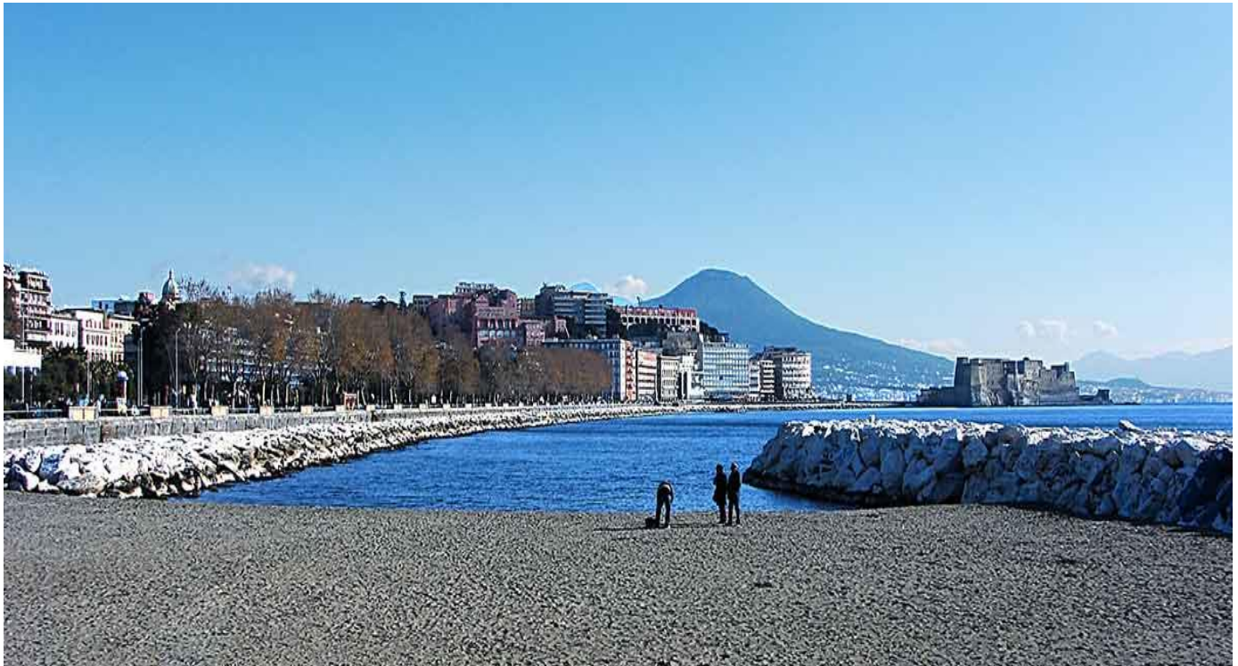
12 Aprile - Arenile Rotonda Diaz.

La quantità di pioggia caduta nell'intero mese è stata pari a 12 mm , l' 80% in meno di quella che cade in mediamente ad Aprile.